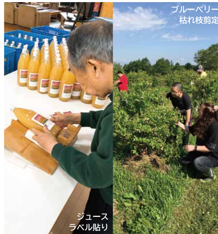
ブルーベリー 枯れ枝剪定