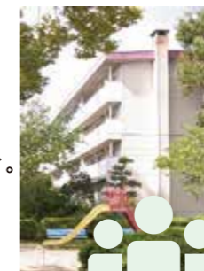
地域の福祉コミュニティ拠点へ

仙台沖野団地再生に向けた パートナーを募集しております。 お気軽にお問い合わせください。